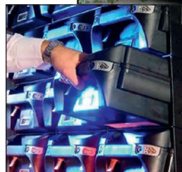
Spinnaker — решение для безопасной транспортировки денег

Аппаратно-программный комплекс на базе Laurel K4 и K4+4 — инновационное решение в области счетно-сортировальных машин, повышающее эффективность работы кассовых центров банков и полностью соответствующее требованиям ЦБ РФ к проверке машиночитаемых защитных признаков банкнот и сортировке по ветхости.